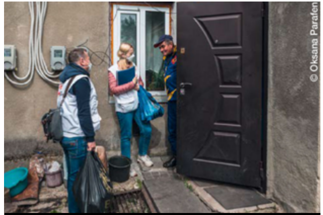
국경없는의사회 사회복지사와 간호사가 지토미르(Zhytomyr) 추드니우(Chudniv) 지역 주민에게 식량 구호품을 전달하고 있다. 간호사와 사회복지사는 심리학자와 함께 환자 지원팀에 소속돼 있는데, 이 팀은 약제 내성 결핵 환자를 지원하며 연금 미지급부터 가스 및 난방 공급 중단까지 치료를 지속하는 데 방해가 되는 요소를 이해하고 해결하기 위해 노력한다.

• 국경없는의사회는 하르키우에서 핫라인을 운영하며 의약품 지원 필요에 대응하고 온라인으로 진료 및 심리상담을 제공한다. 또한 자원봉사자 네트워크를 통해 지역 주민에게 의 약품을 전달하고 있다.