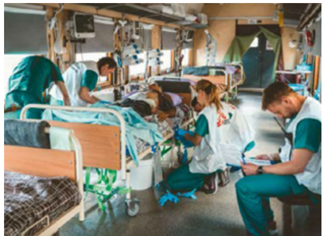
동부 포크로우스크에서 서부 르비우(Lviv)로 향하는 국경없는의사회 의료열차의 집중치료칸에서 의료팀이 중환자의 상태를 관찰하고 있다.

• 이바노 프란키우스크에서는 전쟁으로 피란민이 된 현지 의사들이 운영하는 진료소를 지원하기 시작했다.