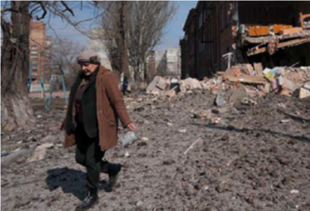
한 여성이 공습으로 파괴된 건물을 지나치고 있다. 2022년 3월 13일.

국경없는의사회는 구급차 이송 서비스도 운영하고 있다. 드니프로 및 포크로우스크(Pokrovsk)의 병원 간 이송 서비스는 해당 지역에서의 격렬한 교전으로 매우 활발하게 운영됐으며, 분쟁 일선 부근 11개 병원의 환자를 드니프로 등 비교적 분쟁 일선과 떨어진 지역으로 이송한다. 9월 시작된 이송 서비스를 통해 국경없는의사회 구급차 및 의료 열차로 400명의 환자를 이송했다.