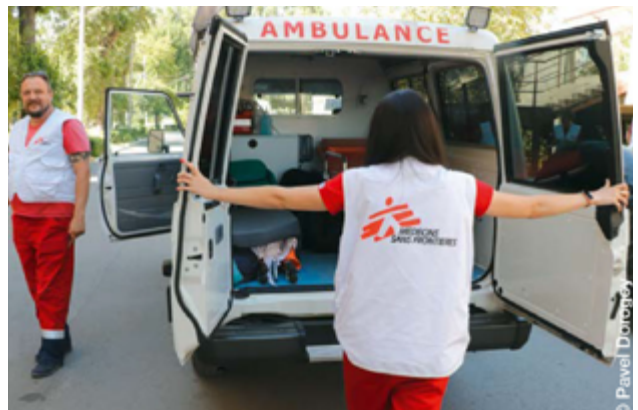
국경없는의사회 구급차 운영팀. 우크라이나 동부에서 분쟁이 격화해 국경없는의사회 구급차 8대가 계속해서 환자를 드니프로 등 분쟁 일선과 비교적 멀리 떨어진 곳으로 이송한다. 국경없는의사회는 의료열차를 통해서도 환자를 동부에서 서부로 이송한다. 이송 대상 대부분은 고령자 또는 거동이 불편하며, 심리적 트라우마에 더해 전쟁 관련 외상을 입은 환자다.

• 도네츠크 및 루한스크주의 국경없는의사회 팀은 해당 지역 내 병원 의료진에게 수술 코칭 및 실습 교육을 제공했다.